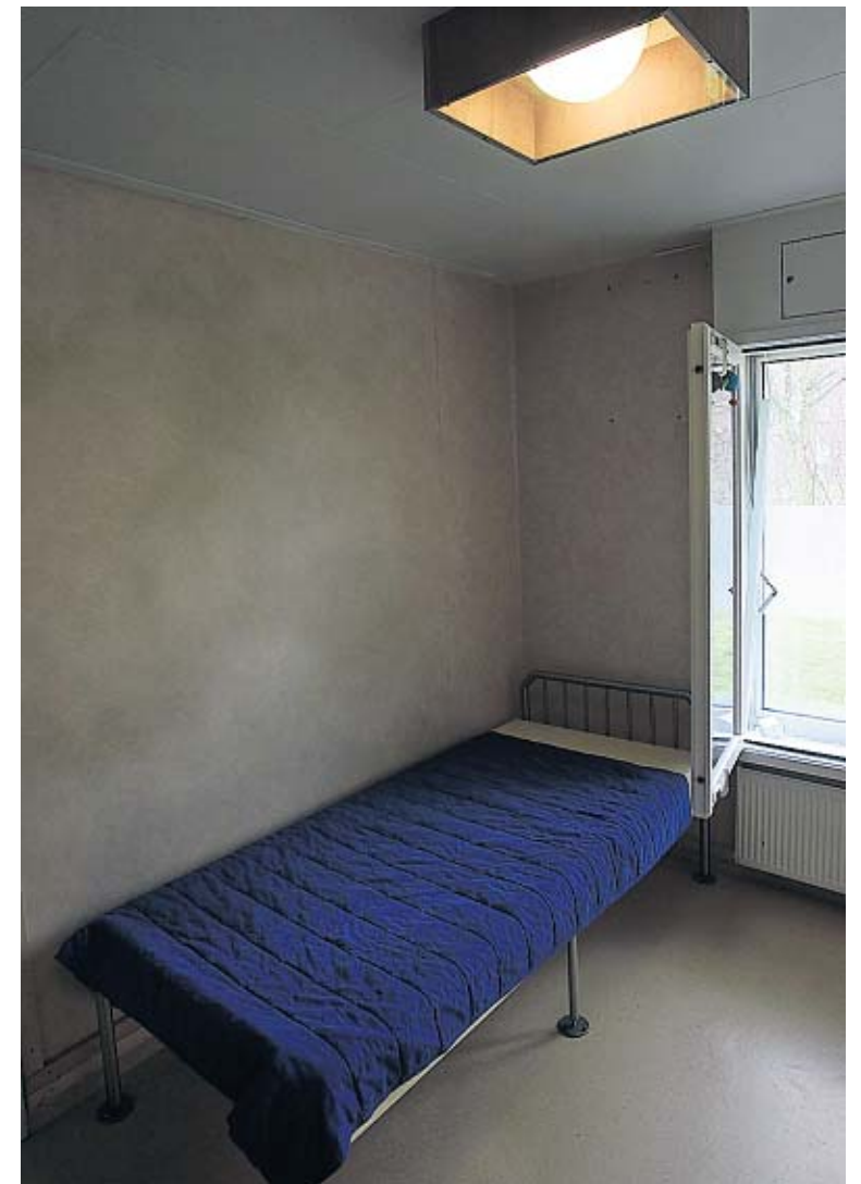
De kale slaapkamer waar Hennie jarenlang 23 uur per dag zat opgesloten.